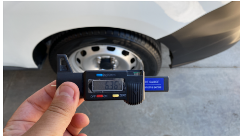
Neumáticos traseros Porcentaje 6.36 mm