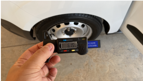
Neumáticos delanteros Porcentaje 6.15 mm