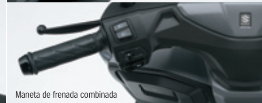
Maneta de frenada combinada