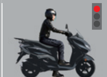
Frenado El sistema EASS detiene automáticamente el motor.