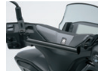
Barra para montaje de accesorios

SUZUKI MOTOR IBÉRICA se reserva el derecho de cambiar, sin previo aviso, el equipamiento, las especificaciones, colores, materiales y otros elementos de los modelos expuestos en este folleto. Todos los modelos pueden ver interrumpida su fabricación sin previo aviso. Pregunte a su concesionario los posibles cambios. Los colores de los carenados pueden variar ligeramente de las fotografías de este folleto. Las imágenes mostradas corresponden a pilotos profesionales tomadas en condiciones controladas.