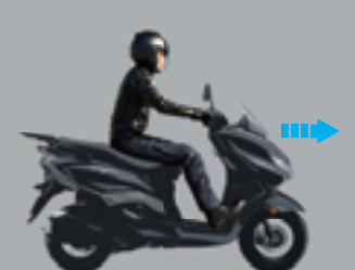
Circulando El scooter funciona normalmente.