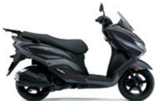
Gris Piedra Lunar (YWC)