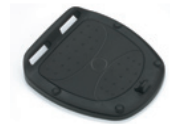
Base adaptadora para Top Case