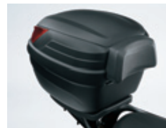
Almohadilla de respaldo para Top Case