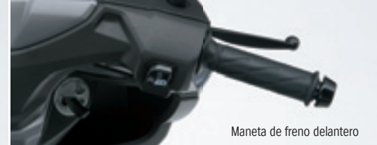
Maneta de freno delantero