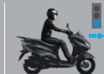
Arrancando de nuevo El motor se pone en marcha silenciosamente con solo girar el acelerador.