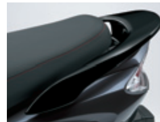
Asidero para el pasajero