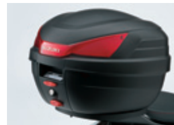
Top Case de plástico (27 L)