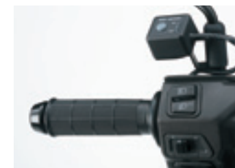
Juego de puños calefactados

Aprovecha los accesorios originales para personalizar tu scooter con opciones adicionales de confort y comodidad que satisfagan tus necesidades y se adapten a tu estilo