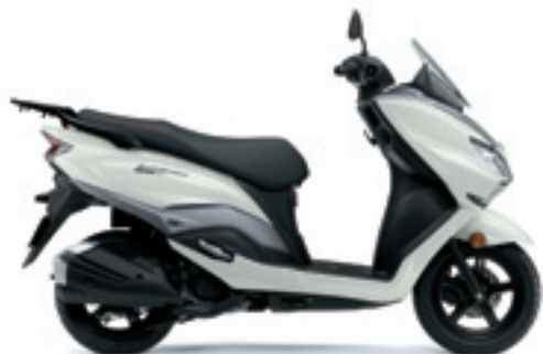
Blanco Nacarado (YPA)