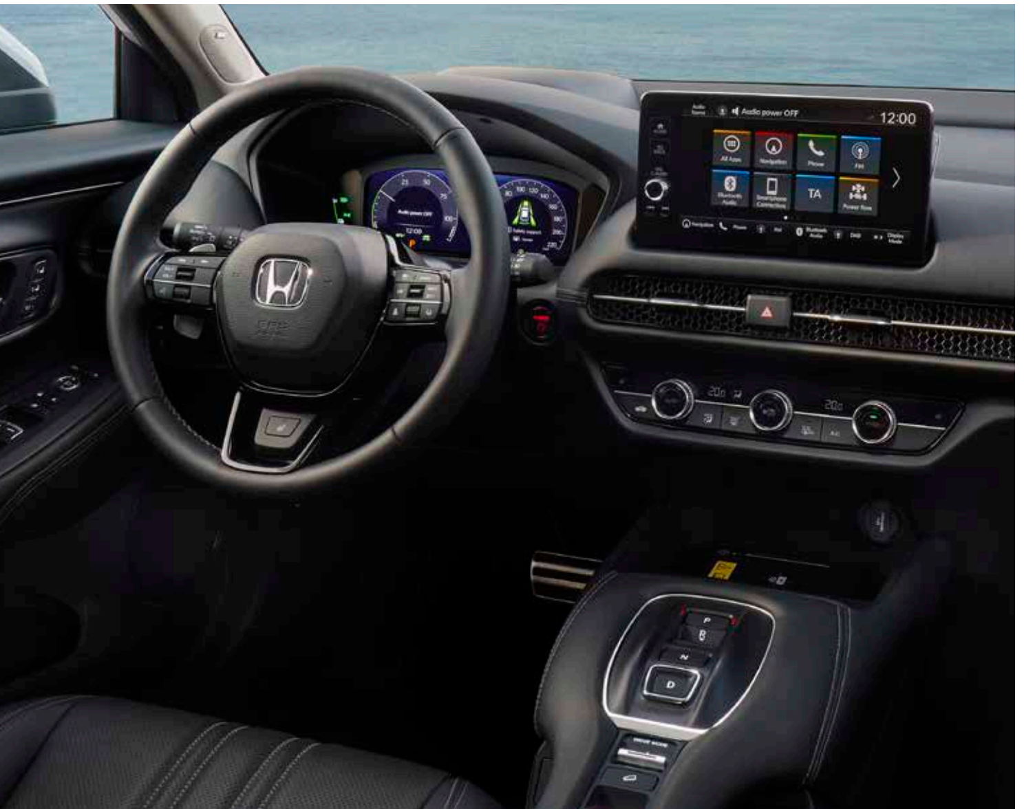
Nuevo Honda ZR-V e:HEV