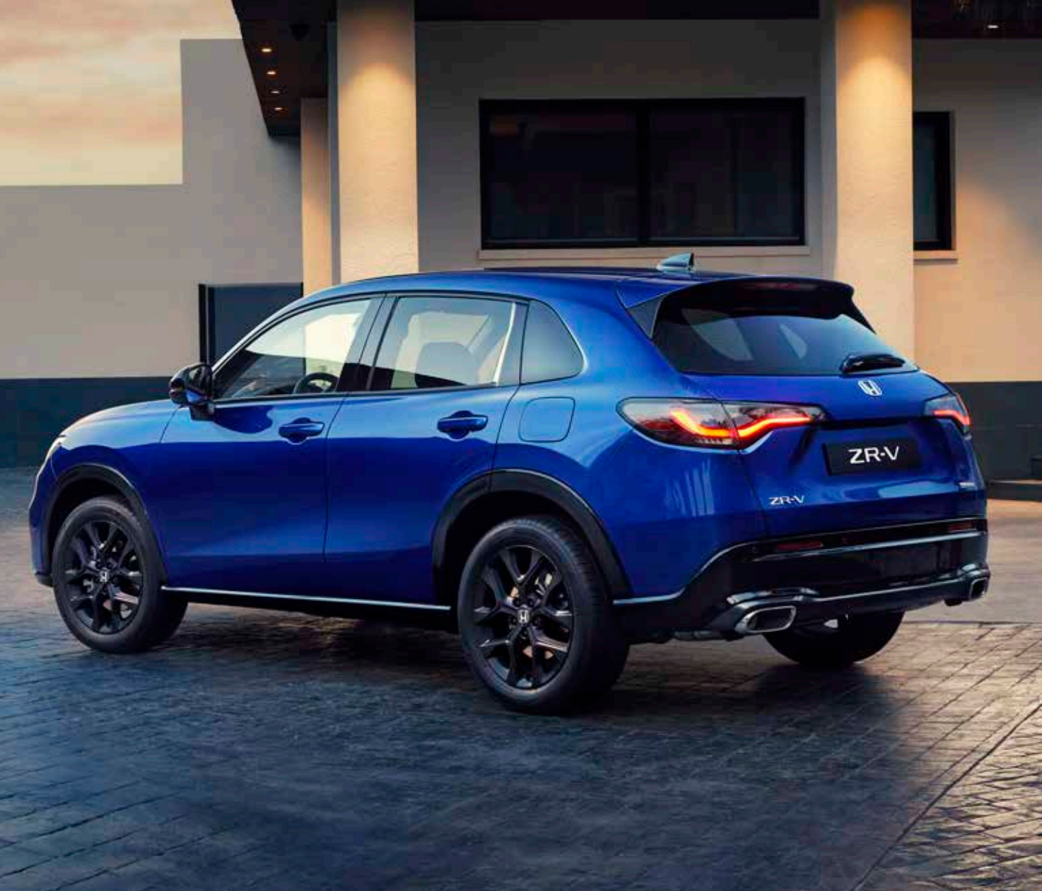
Nuevo Honda ZR-V e:HEV