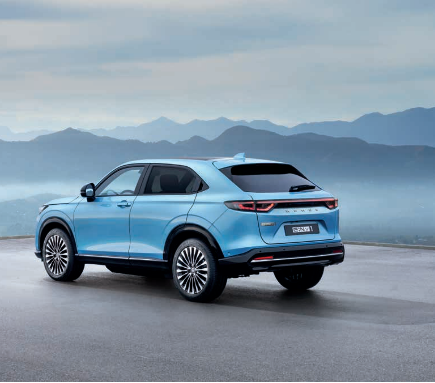
Nuevo Honda e:Ny1