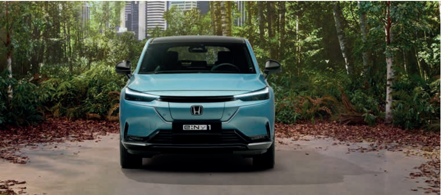
Nuevo Honda e:Ny1