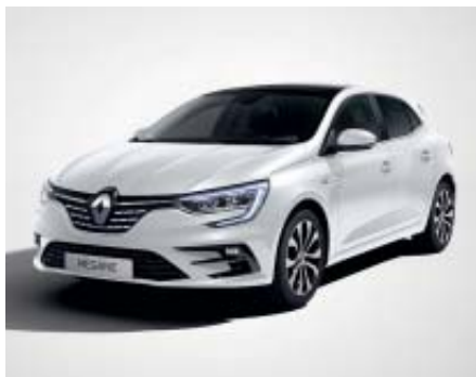
Blanco Nacarado (2)