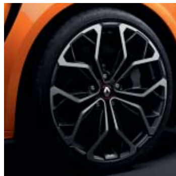
Llanta R.S. Interlagos Diamantada Negra 48 cm (19")