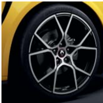
Llanta R.S. Trophy Fuji Light 48 cm (19")