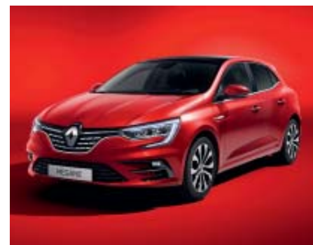
Rojo Deseo (2)