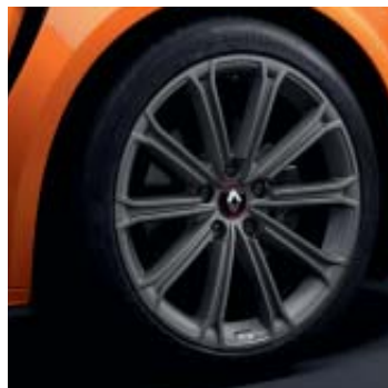
Llanta R.S. Estoril 46 cm (18")