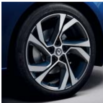
Llanta R.S. Line Magny-Cours 46 cm (18")