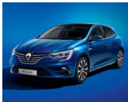
Azul Rayo (2)