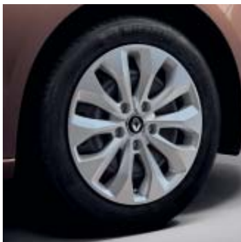
Embelledor Florida 41 cm (16")