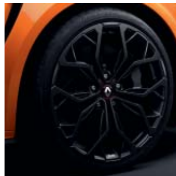
Llanta R.S. Interlagos Negra 48 cm (19")