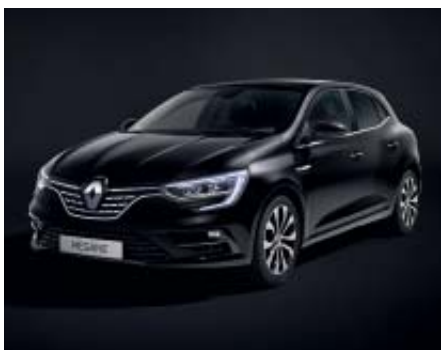
Negro Brillante (2)