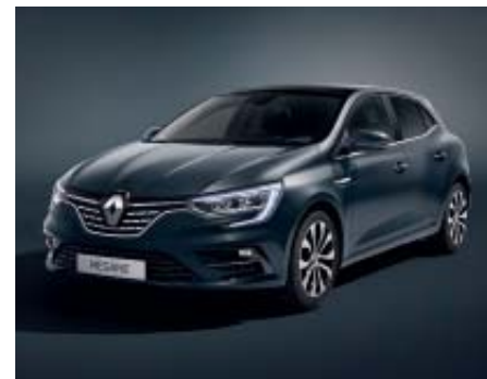
Gris Titanium (2)