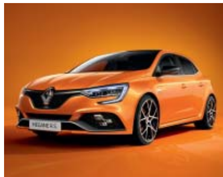
Naranja Tonic (2)