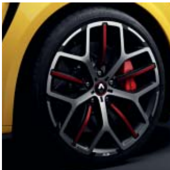
Llanta R.S. Trophy Jerez 48 cm (19")