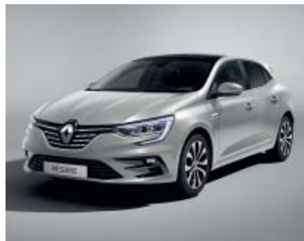
Gris Highland (2)