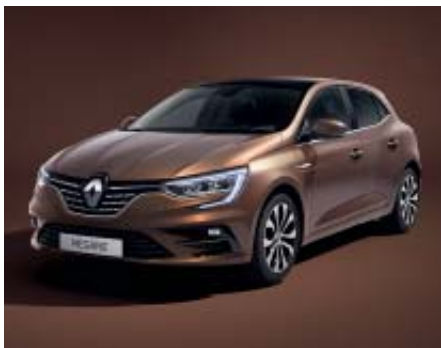
Cobre Solar (2)