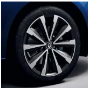
Llanta R.S. Line Montlhery 43 cm (17")