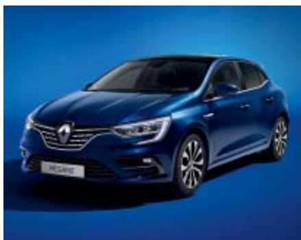
Azul Cosmos (2)