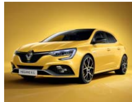
Amarillo Racing (2)

(1) Pintura opaca. (2) Pintura metalizada. Fotos no contractuales.