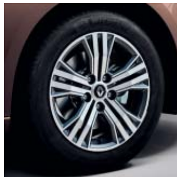
Llanta aleación Impulse 41 cm (16")