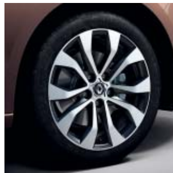
Llanta aleación Allium 43 cm (17")