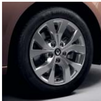
Llanta aleación Celsius 41 cm (16")