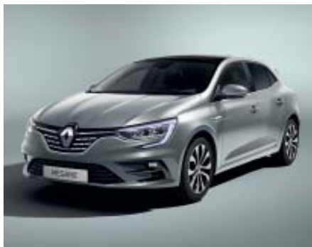
Gris Báltico (2)